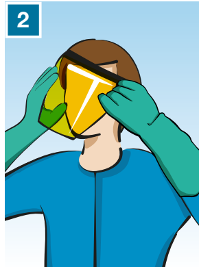
2 Togli la visiera, lavala e asciugala all'aria