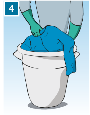
4 Togli la tuta e riponila nel contenitore per lo smaltimento