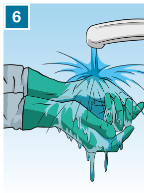
6 Lava i guanti più volte evitando spruzzi