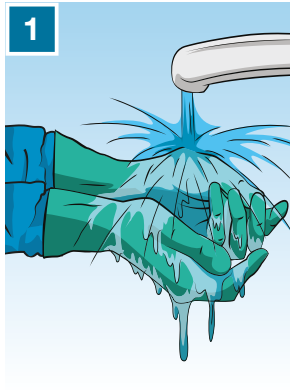
1 Lava le mani senza togliere i guanti

La fase di svestizione può essere un altro momento critico di manipolazione e quindi va fatta prestando la massima attenzione. Questa operazione deve essere effettuata nell'area di lavaggio; qui trovi alcuni utili consigli sulla sequenza delle operazioni da seguire per la svestizione dopo aver eseguito il trattamento.