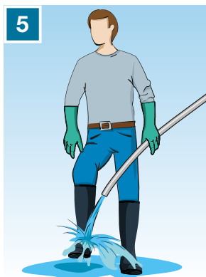
5 Rilava gli stivali, quindi togliili